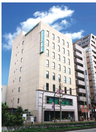
▲京都本社ビル 最新情報を一堂に集めて皆様のお越しをお待ち致しております。