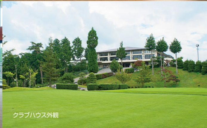
クラブハウス外観